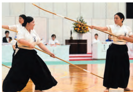
なぎなた成年女子演技