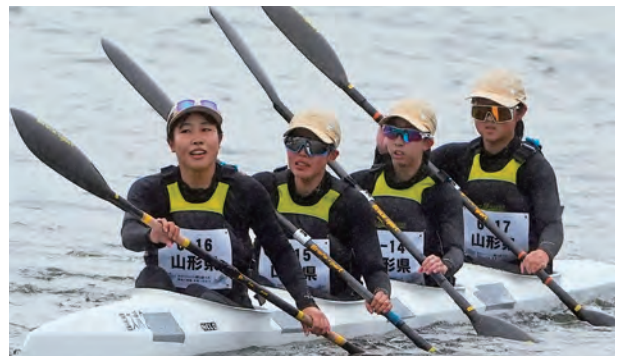
カヌースプリント500m少年女子カヤックフォア