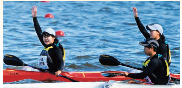
カヌースプリント200m少年女子カヤックペア