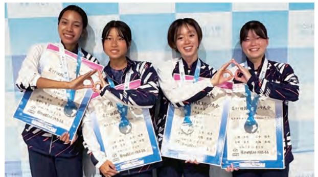
陸上競技成年少年女子共通4×100m